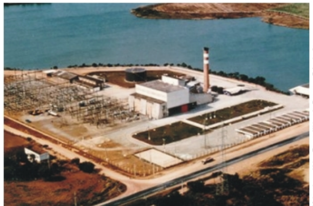
Visa aérea - Usina Termoelétrica de Campos - Subestação

Desde a partida das máquinas da termoelétrica do complexo FURNAS CENTRAIS ELÉTRICAS no município de Campos, estado do Rio de Janeiro, o pessoal de operação das caldeiras se queixava de uma dificuldade operacional, qual seja ter uma boa e confiável supervisão do nível do tubulão da caldeira, leitura do nível sem clareza e nitidez, problemas de vazamentos e manutenção excessiva, eram entre outras as dificuldades encontradas pela operação.